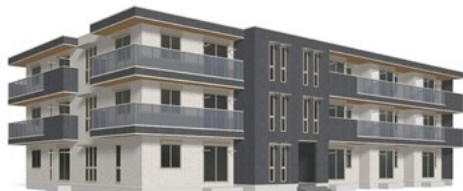
建築前のイメージベースである為、実際とは異なる場合がございます。