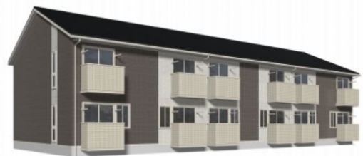
※イメージ図の為、実際とは異なる場合がございます。